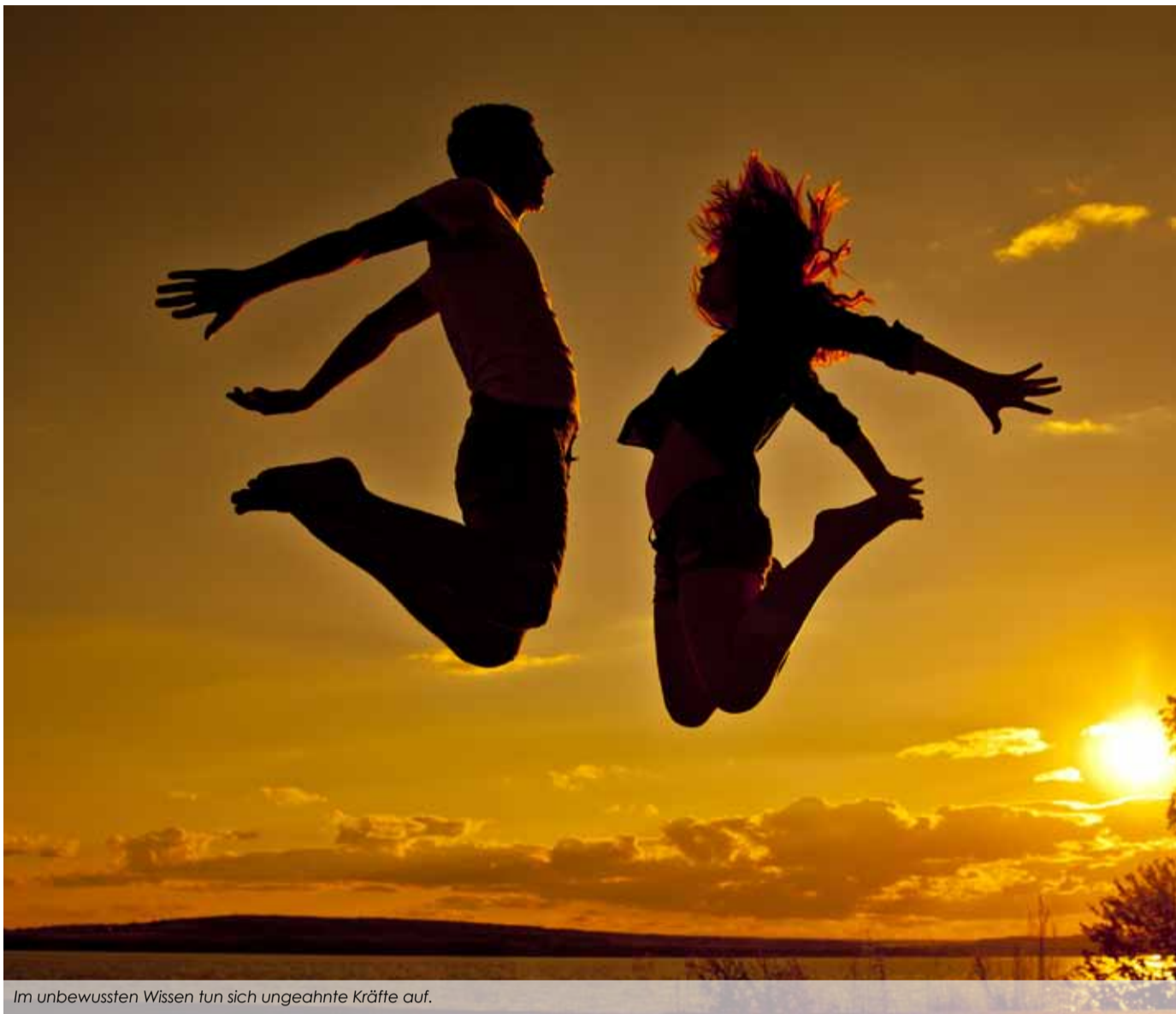
Im unbewussten Wissen tun sich ungeahnte Kräfte auf.