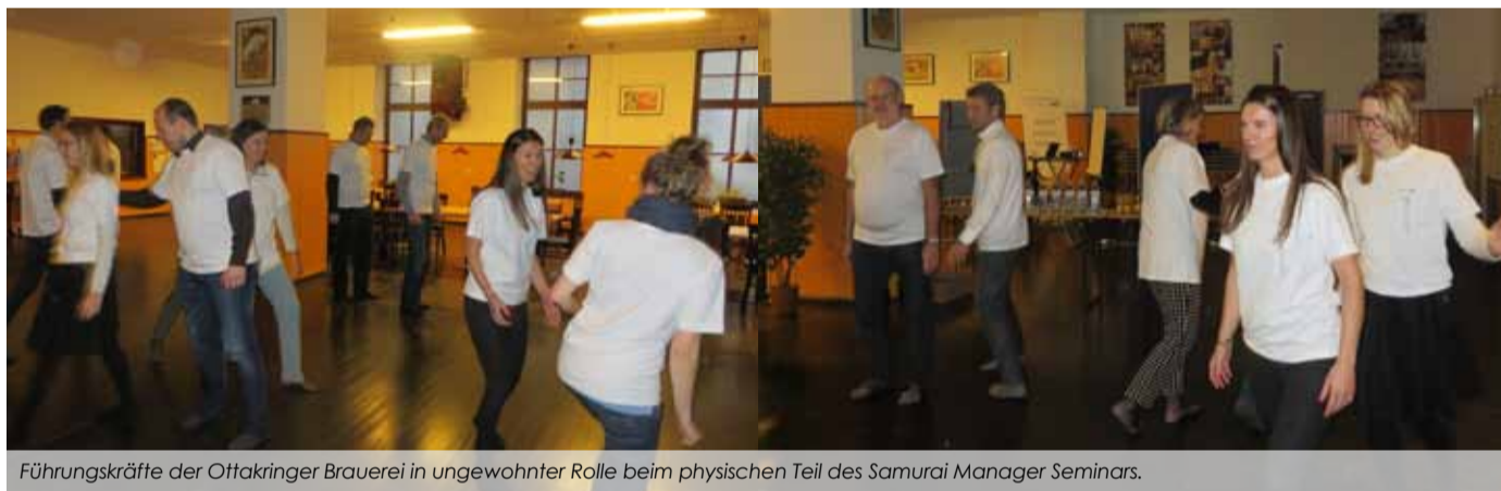
Führungskräfte der Ottakringer Brauerei in ungewohnter Rolle beim physischen Teil des Samurai Manager Seminars.