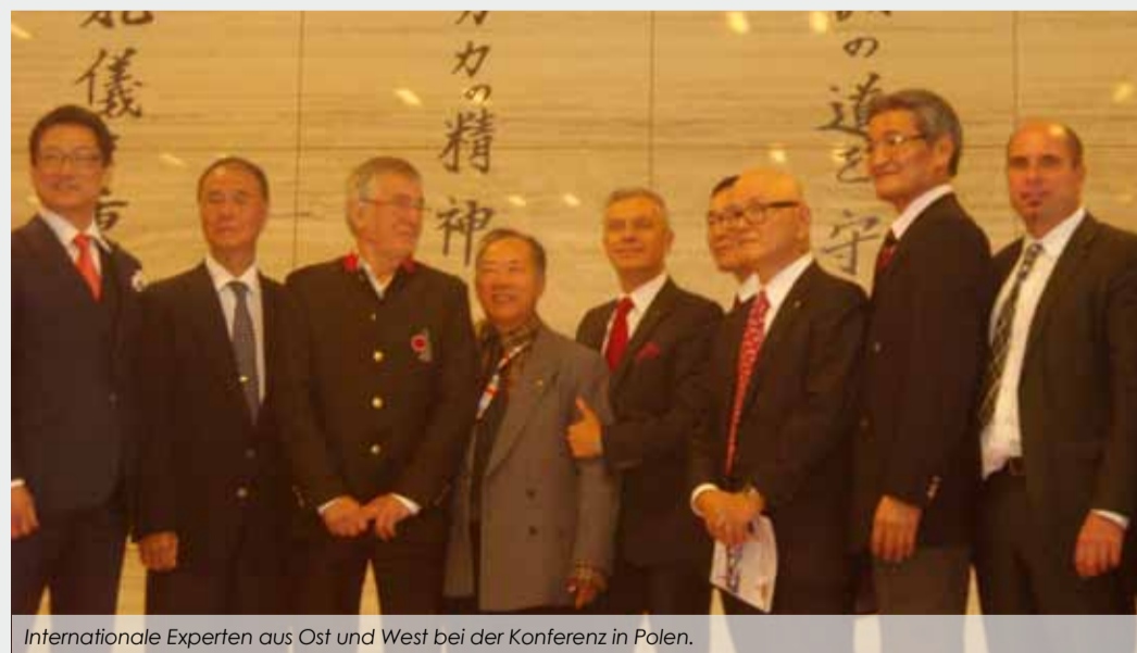
Internationale Experten aus Ost und West bei der Konferenz in Polen.